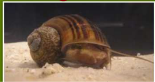
ジャンボタニシくんが田んぼのお掃除してくれます!